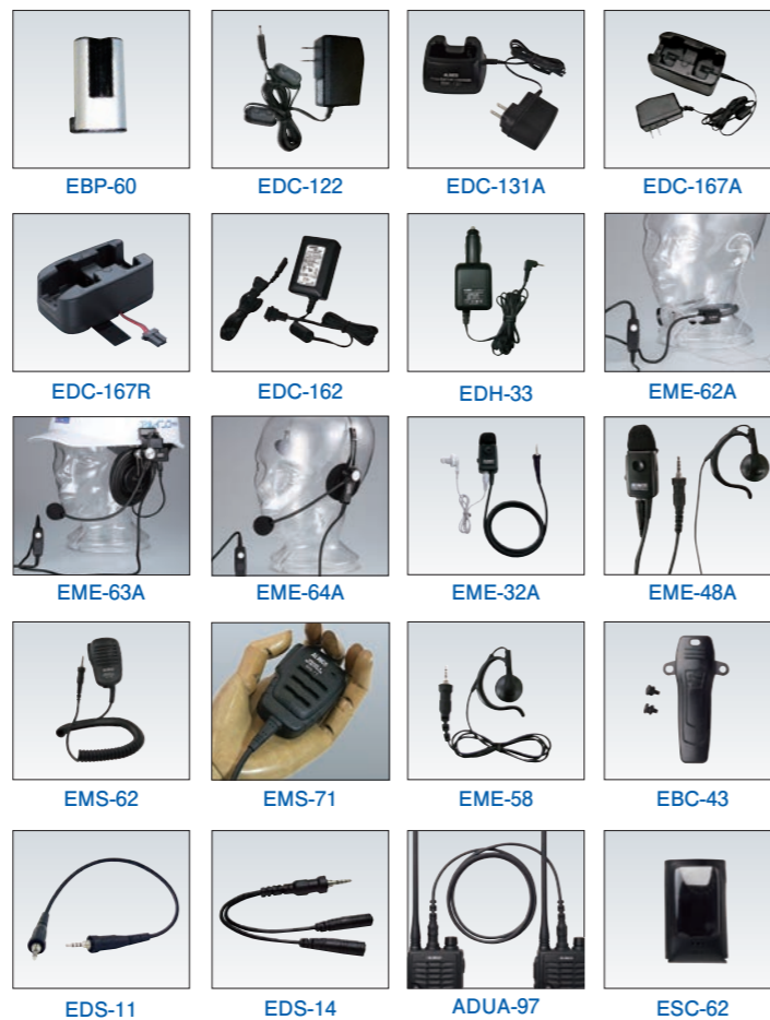
EBP-60 EDC-122 EDC-131A EDC-167A EDC-167R EDC-162 EDH-33 EME-62A EME-63A EME-64A EME-32A EME-48A EMS-62 EMS-71 EME-58 EBC-43 EDS-11 EDS-14 ADUA-97 ESC-62